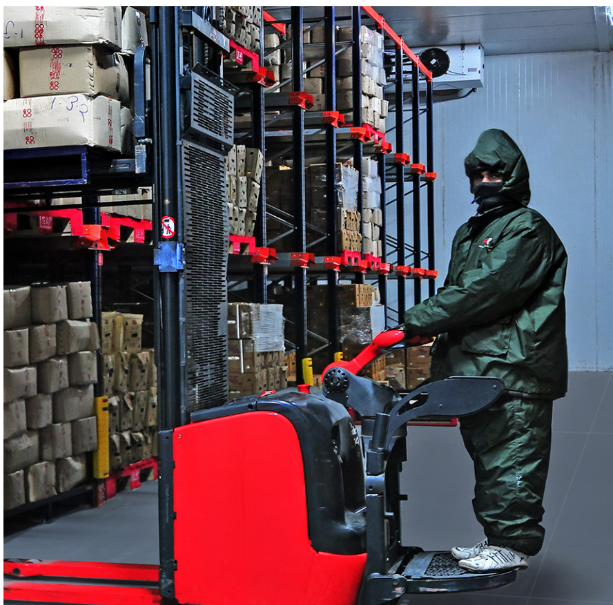
Espacio de almacenamiento frigorífico.