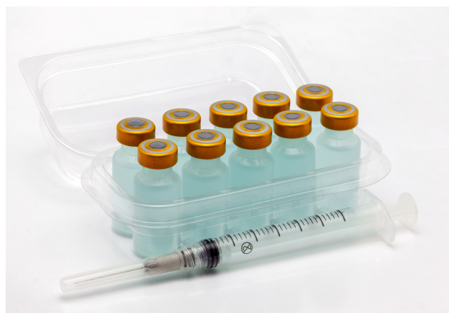
Vacunas y medicamentos.